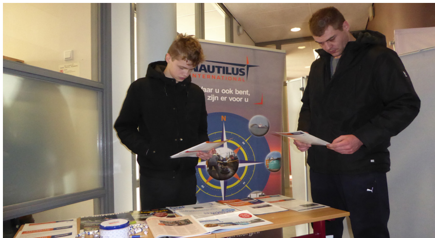
Een FNV Waterbouw lid (rechts) bezoekt de Nautilus stand, samen met zijn zoon, die MBO Binnenvaart wil gaan doen.

Ook bij de Nautilus stand lieten een aantal jongeren en hun ouders zich informeren over waar de maritieme vakbond voor gaat en staat. Uiteraard werd het speciale lidmaatschap voor studenten gepromoot, waarbij men voor slechts € 3,75 per maand onze vakbladen 'Telegraph' en 'SWZ Magazine' toegezonden krijgt. Verder biedt het lidmaatschap een 24/7 service, waardoor onze (jonge) leden ons altijd kunnen benaderen, ongeacht waar men zich bevindt in de wereld. Nieuwsgierig geworden