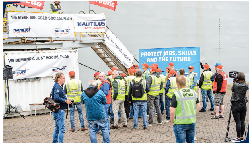
kaderleden in actie

International, de actuele contributieregeling en digitale aanmeldingsformulieren kunt u vinden op www.nautilusint.org/nl